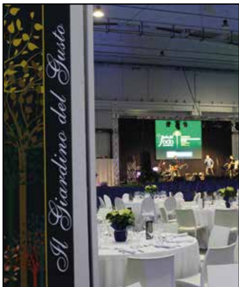
Gli addobbi della sala.